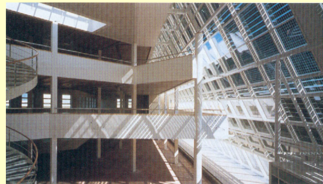
☞ Vista interna della facciata