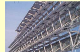
⚡ Particolare dei moduli FV in facciata