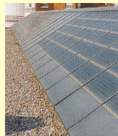
☞ Particolare dei moduli FV in copertura