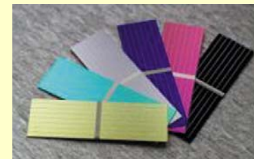
☞ integrazione architettonica di moduli FV realizzati con celle colorate