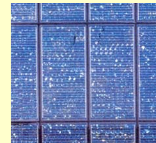
☞ Particolare dei moduli FV in facciata